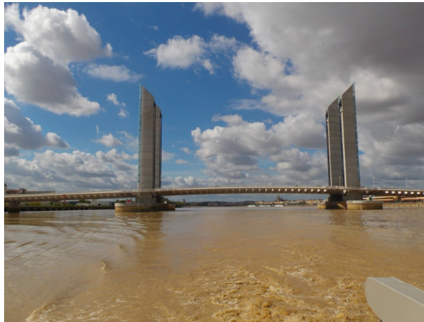
Une vue des quais de Bordeaux

Le nouveau pont Jacques Chaban Delmas mis en service en 2013