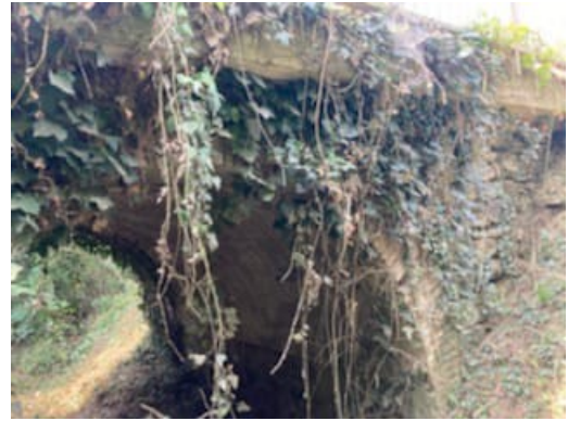
Nettoyage du pont Lastours

Une réfection des ponts de la commune a été entreprise cet été. Les ponts de Labarrat et de Lastours ont été nettoyés.