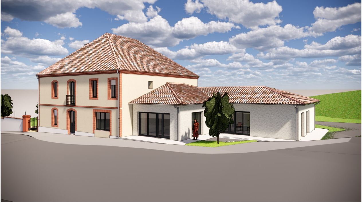
Vue depuis la route départementale