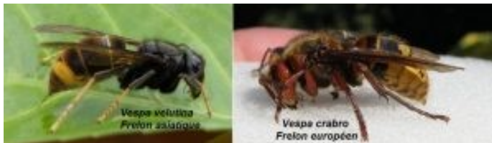
À gauche: frelon asiatique Vespa velutina nigrithorax

Chaque printemps, les reines frelons asiatiques s'éveillent et fondent un nouveau nid, donnant naissance aux premières ouvrières. C'est le moment d'agir pour limiter les dégâts.