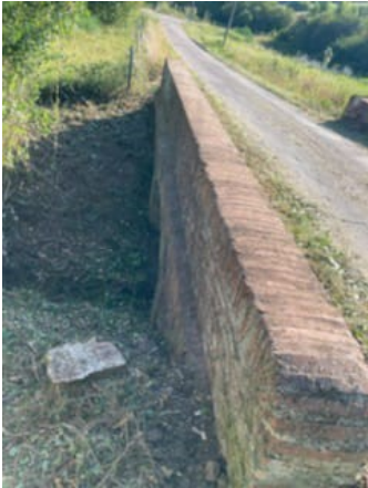
Nettoyage du pont de Labarrat