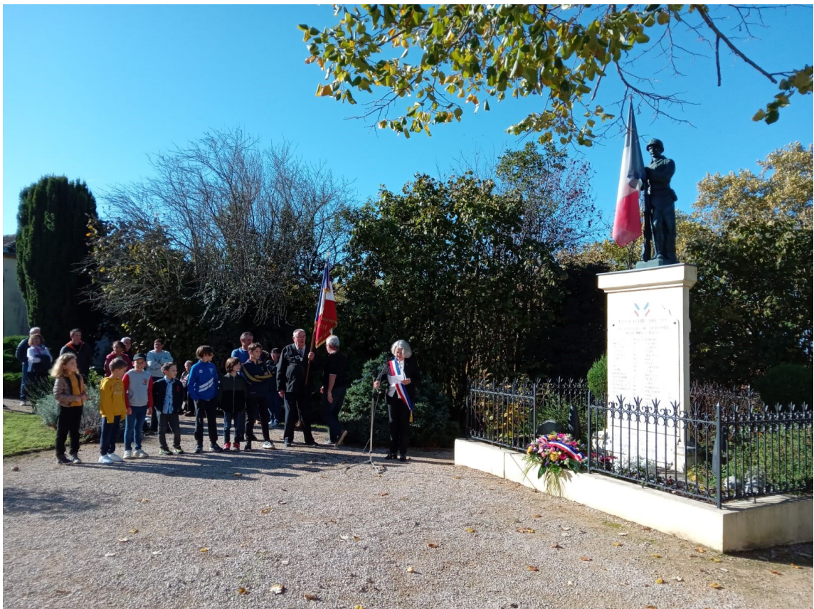
La commémoration du 11 novembre