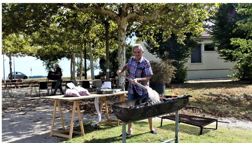
PREPARATION DU REPAS