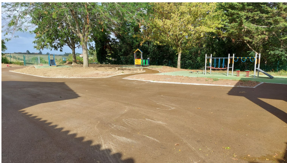
Cour de l'école maternelle avec son aire de jeux.

Les enfants ont eu le plaisir de découvrir un tout nouvel espace extérieur ludique et fonctionnel, tout en conservant des espaces enherbés et des zones ombragées.