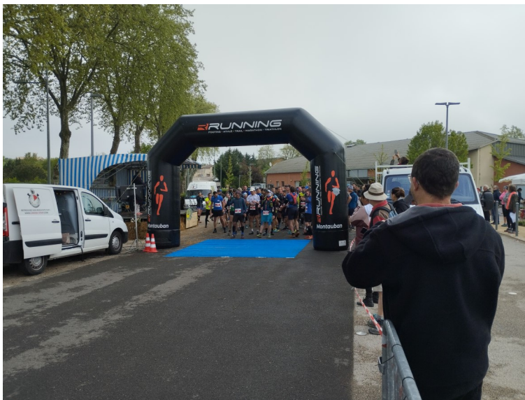
Départ de la 1ère édition du TRAIL DES CLOCHERS

Nous serons heureux de vous retrouver nombreux pour ces animations ! Bonnes fêtes de fin d'année, Amicalement, Tout l'équipe de l'APE