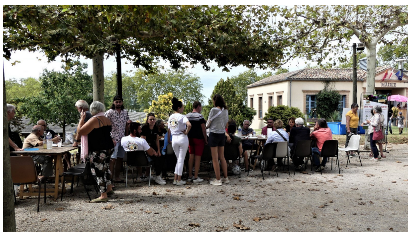
REPAS CONVIVAL DES INTERVENANTS