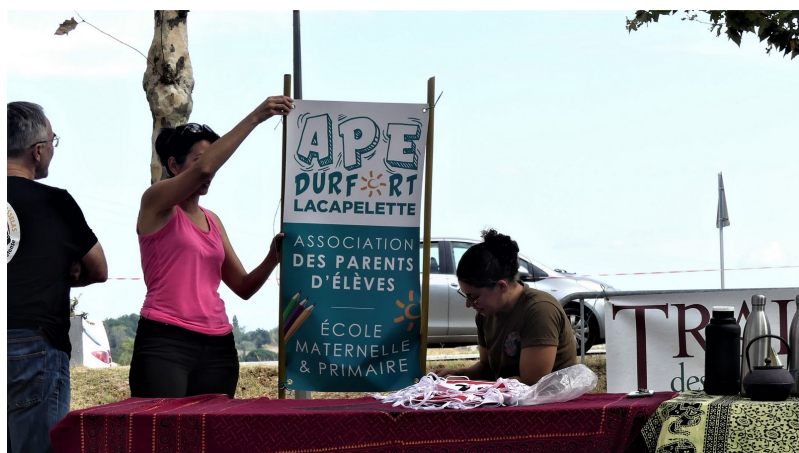
L'APE DURFORT LACAPELETTE MET SON STAND EN PLACE