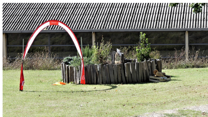
ORGANISATION D'UN MINI TRAIL POUR LES ENFANTS