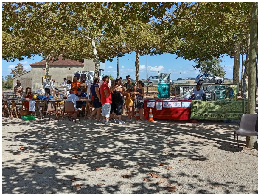
PRÊTS POUR ACCUEILLIR LES VISITEURS