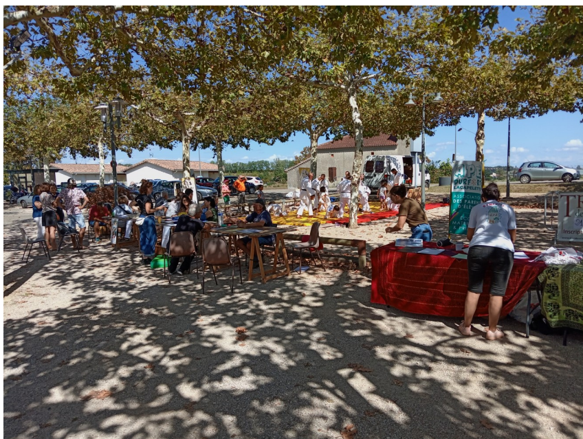
ORGANISATION DES STANDS