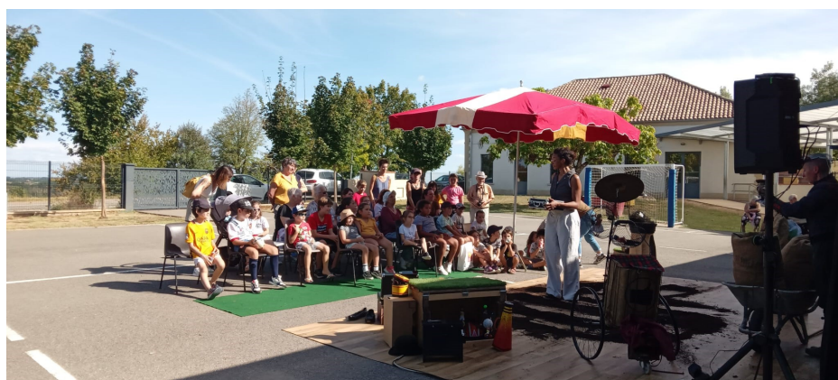
Spectacle de marionnettes pour le Forum des Associations