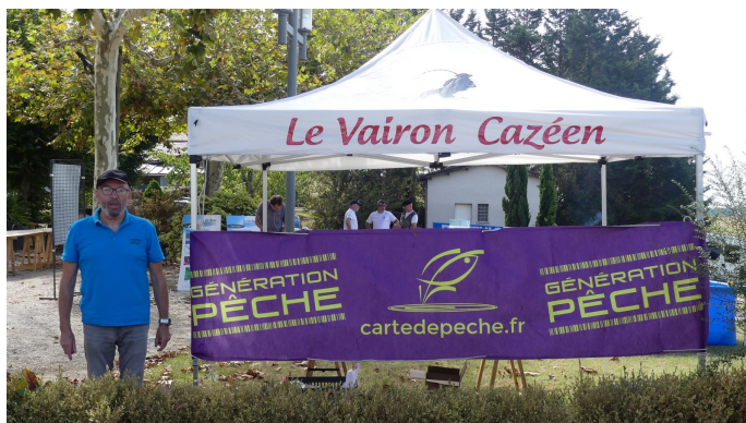
LE STAND DU VAIRON CAZEEN

INITIATION A LA PÊCHE ET A LA CONNAISSANCE DES DIFFERENTES ESPECES DE NOTRE REGION