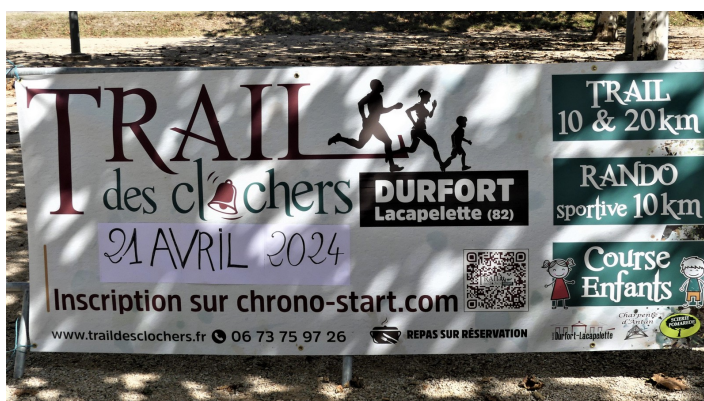
AFFICHE DE LA 2 ème EDITION DU TRAIL DES CLOCHERS