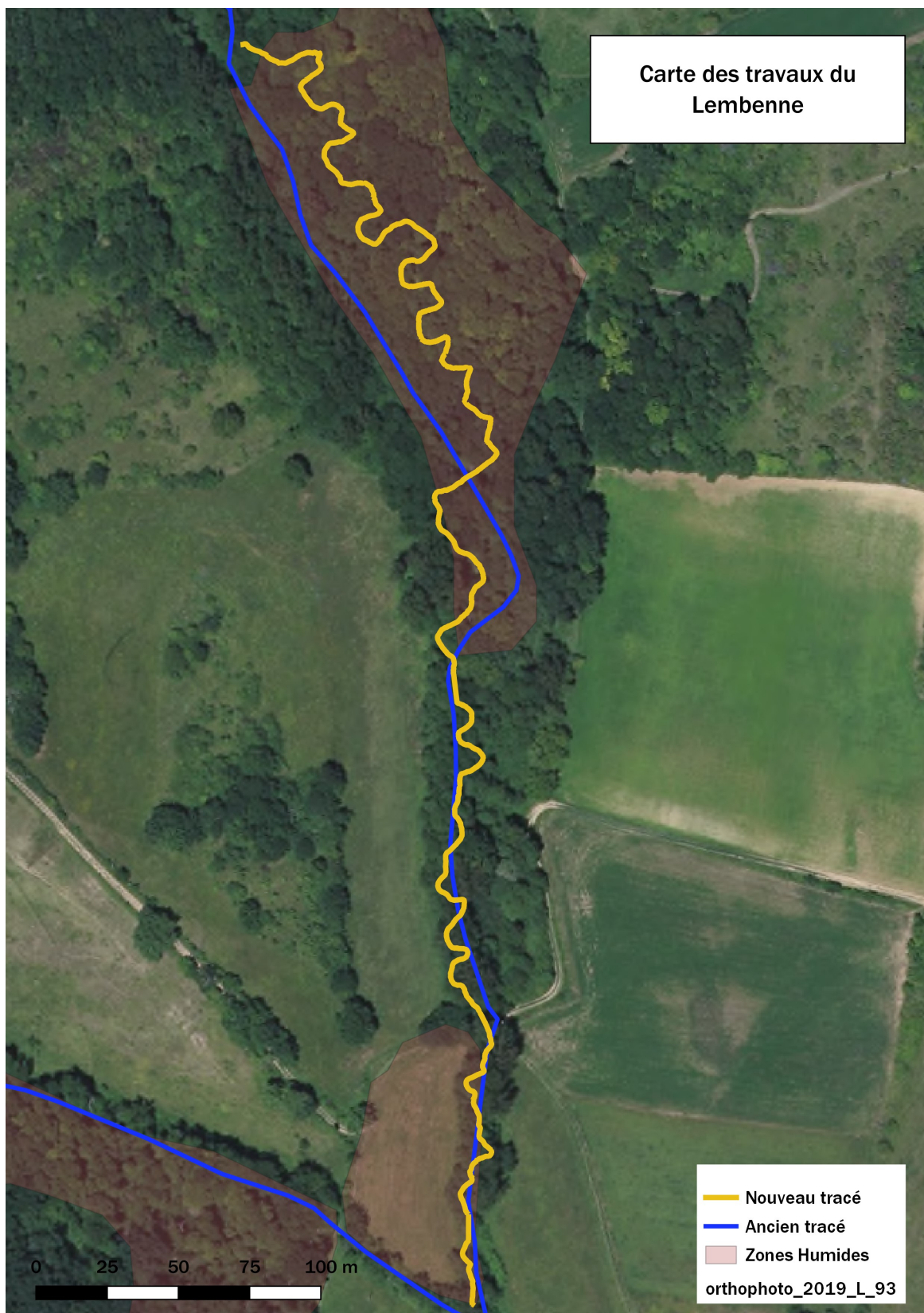
vue aérienne des travaux réalisés sur le Lembenne

En 2022 et 2023, un nouveau projet de renaturation d'un ruisseau par reméandrage a été réalisé sur le Lembenne au niveau des communes de Durfort-Lacapelette et Moissac .