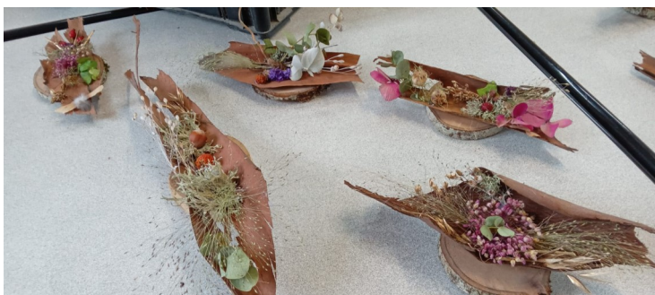
Confection des centres de tables par les CM1 avec Libeth pour le repas de la fête des trieuses

N'hésitez pas à nous contacter si vous voulez faire partie de l'équipe, nous vous promettons un accueil chaleureux et de beaux moments de partage à venir. Contact : 06.84.70.63.54