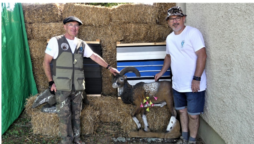
Avec des intervenants de l'association ASCA82 de MONTAUBAN