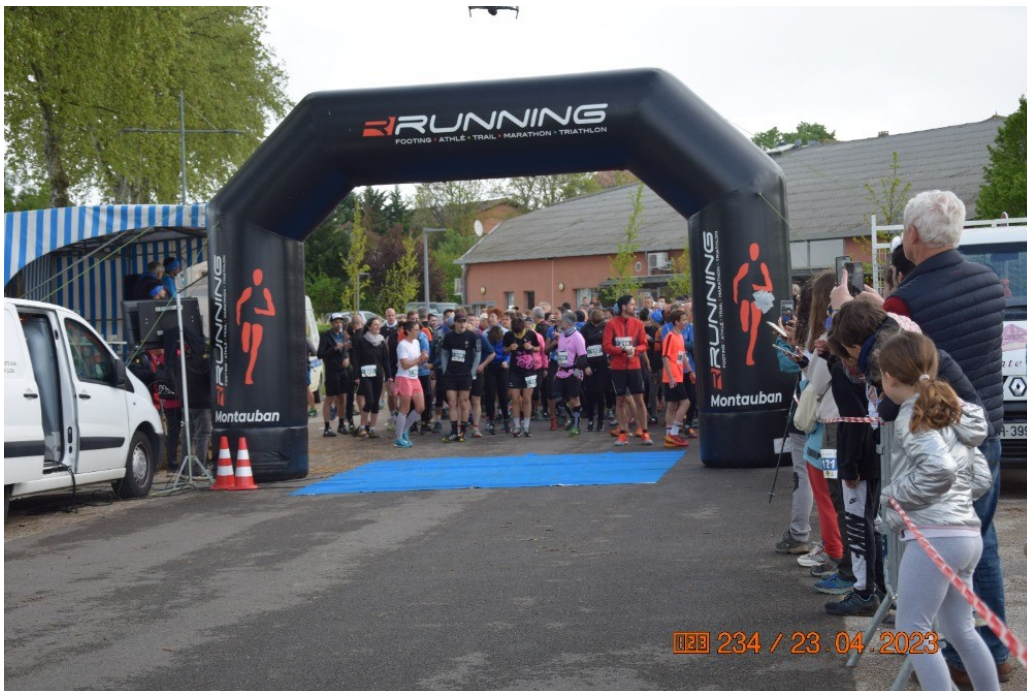
Le tout premier départ du Trail des Clochers

La 1ère édition du TRAIL DES CLOCHERS a été un succès incroyable avec plus de 500 participants et 70 enfants qui ont eu leur propre course le dimanche 23 avril dernier.